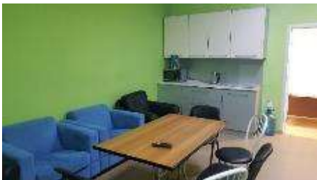
Комната отдыха г. Сухой Лог, ул. Пушкинская 1