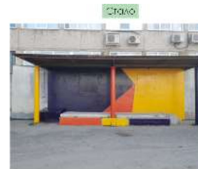
г. Кушва, ул. Строителей, 13