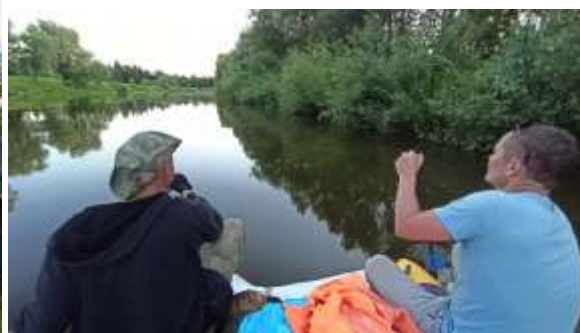
02.07.2022 туристический слет СЦ г. Березники и СУ г. Губаха в г. Соликамске. В мероприятии приняли участие 50 чел. Все участники зарядились энергией, получили призы и массу эмоций.